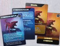
4 карти Кіберпса