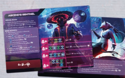
3 аркуші Босів