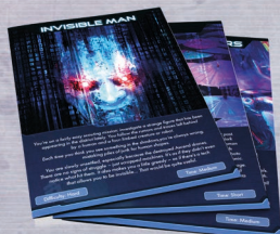
5 аркушів Сценаріїв