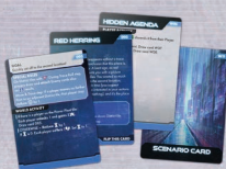
50 карт Сценаріїв