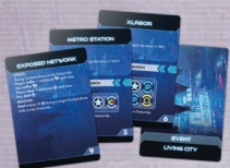
12 карт Подій Живого Міста