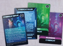
13 карт Кіберкота